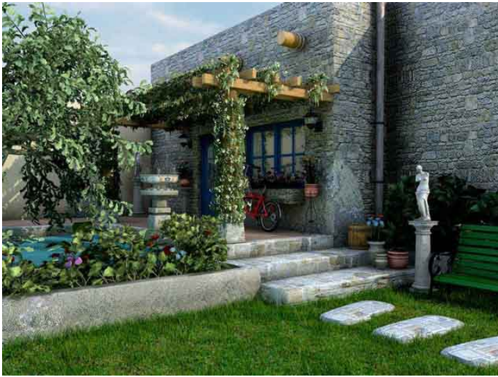
Copyright Gregor Kumbel and Alex Sander. GNU Free Documentation License. Low Resolution